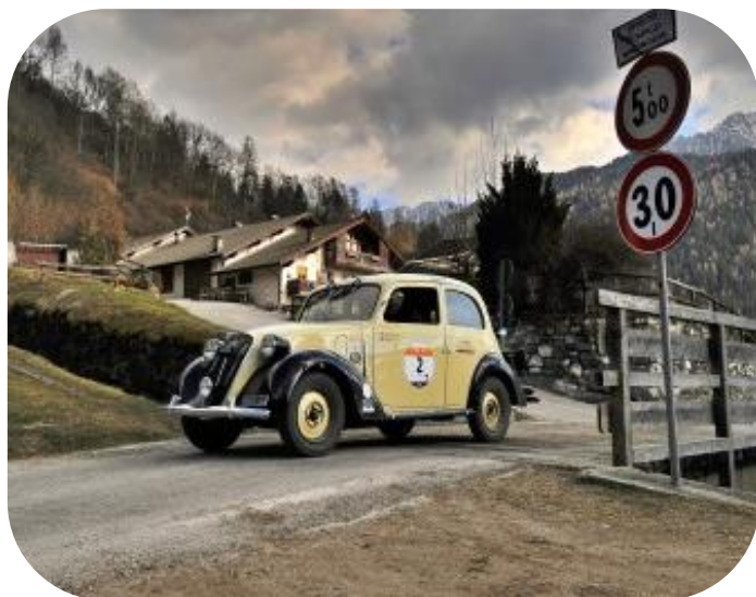
FIAT 508 C - 1937