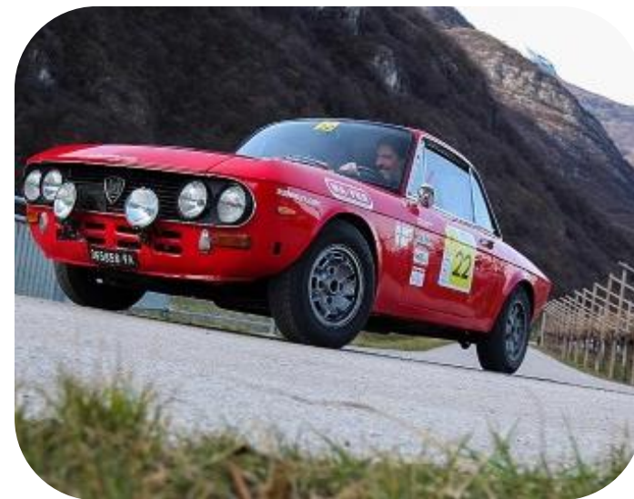
LANCIA FULVIA HF - 1971