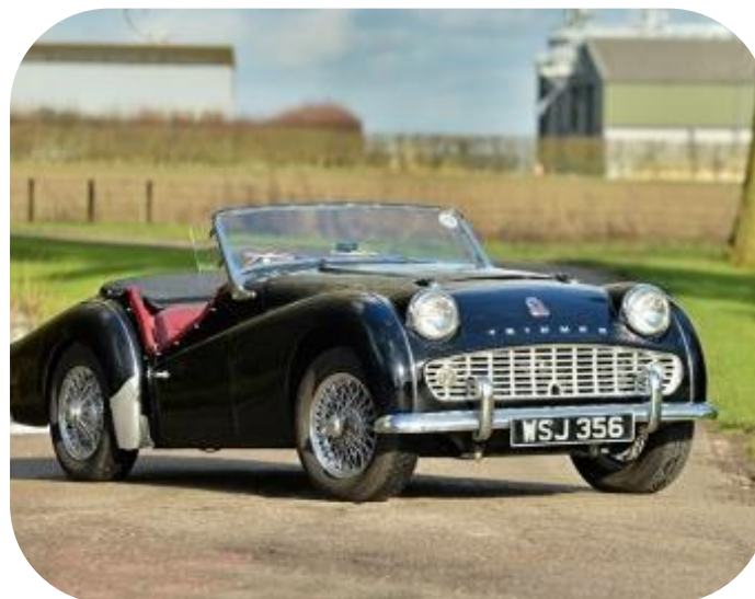
TRIUMPH TR3 - 1962